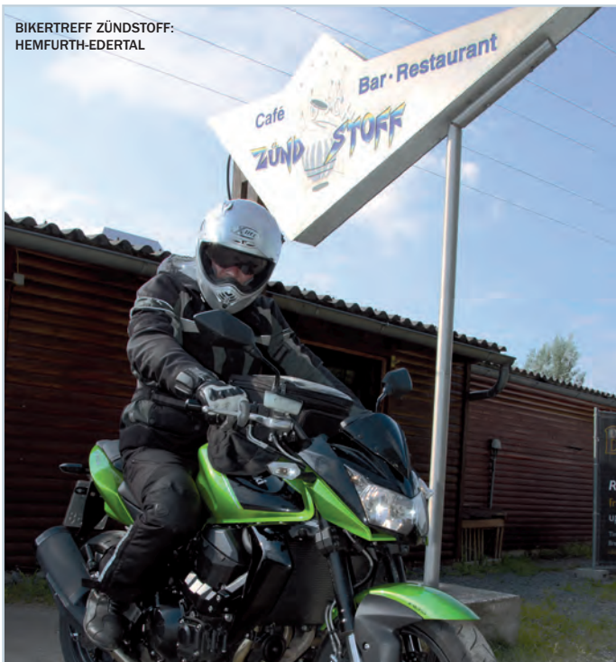
BIKERTREFF ZÜNDSTOFF: HEMFURTH-EDERTAL

Unsere Route führt uns jetzt an Frankenberg vorbei, das vor allem die Fans von historischen Altstädten begeistert. Das zehntürmige Rathaus und jede Menge Fachwerk bieten viel fürs Auge, einladende Cafés sorgen für Kaloriennachschub in Form von leckerem Kuchen.