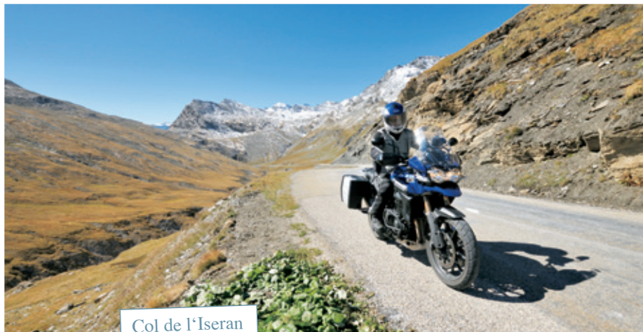
Col de l'Iseran