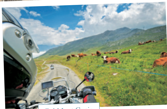
Col Mont Cenis