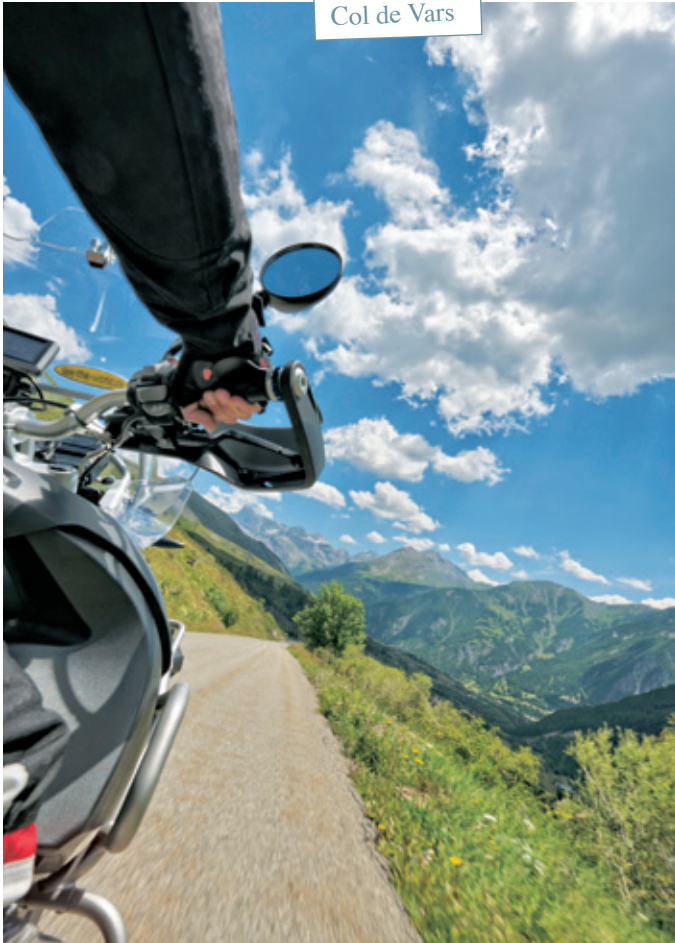
Col de Vars