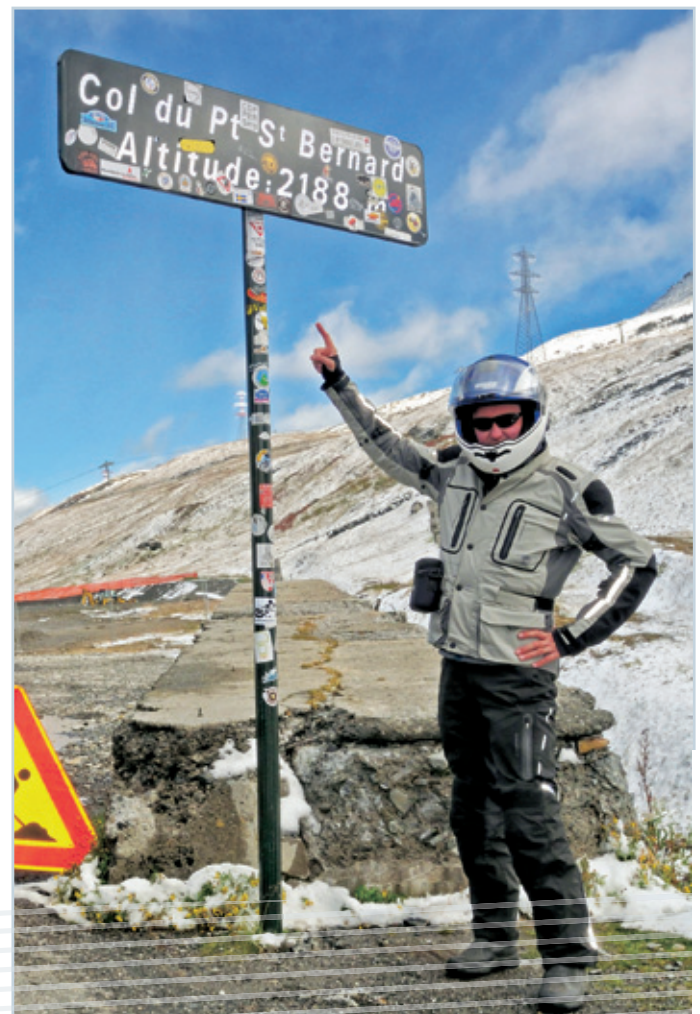
Col du Petit Saint Bernard

Wir erobern jedenfalls zuerst einmal den Col de la Forclaz, der mit seinen 1.527 m alles andere als nur ein kleiner Warmfahrspaß ist und stattdessen den Eidgenossen noch einmal einen Kurzbesuch ab. Der Große St. Bernhard führt uns dann auf fast 2.500 m mit gigantischen Ausblicken nach Italien, genauer gesagt ins Aosta-Tal. Aber mit dem Kleinen St. Bernhard, der hier natürlich schon wieder „Col“ heißt, geht's zurück in unser Zielland Frankreich, um im lebhaften Bourg-Saint-Maurice vor einem typischen Straßen-café zu stoppen.